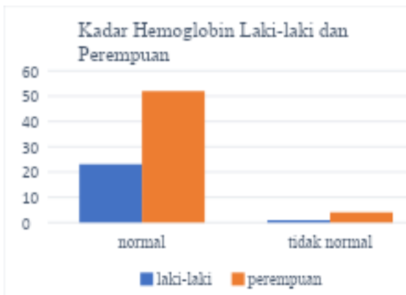
Gambar 1. Perbandingan Kadar Hemoglobin Subjek Penelitian

Berdasarkan hasil identifikasi didapatkan bahwa kategori kebugaran yang diukur nilai VO 2 max didapatkan VO 2 max paling banyak pada kategori rendah dan sedikit yang nilainya dalam kategori baik seperti yang tercantum pada gambar 2 dan tabel 2 berikut ini.